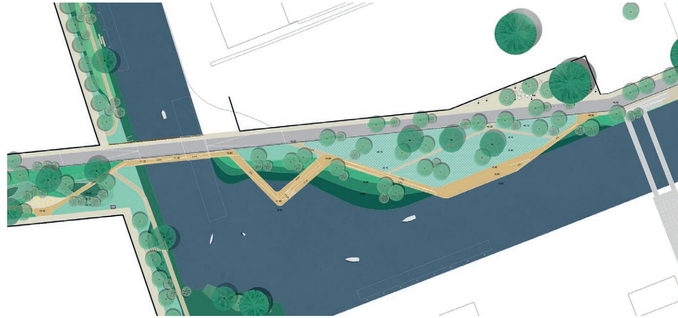
De Suikerbrug en de groene Suikerkade met boardwalk

Vanuit de binnenstad fiets of loop je via de nieuwe Suikerbrug (voorlopige naam) over het Hoendiep naar De Suikerzijde. Een echte blikvanger wordt de 'boardwalk': langs het Hoendiep komt een prachtig breed houten wandelpad met veel groen, lekkere zitplekken en mooie uitzichtpunten aan de natuurlijke oevers van het Hoendiep. De oevers bieden tevens veel ruimte aan plant en dier.